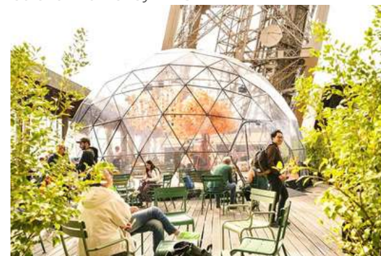
Tour Eiffel Paris

Nos arbres artificiels de grande taille apportent une touche de nature et d'élégance, transformant chaque espace en un lieu d'exception.