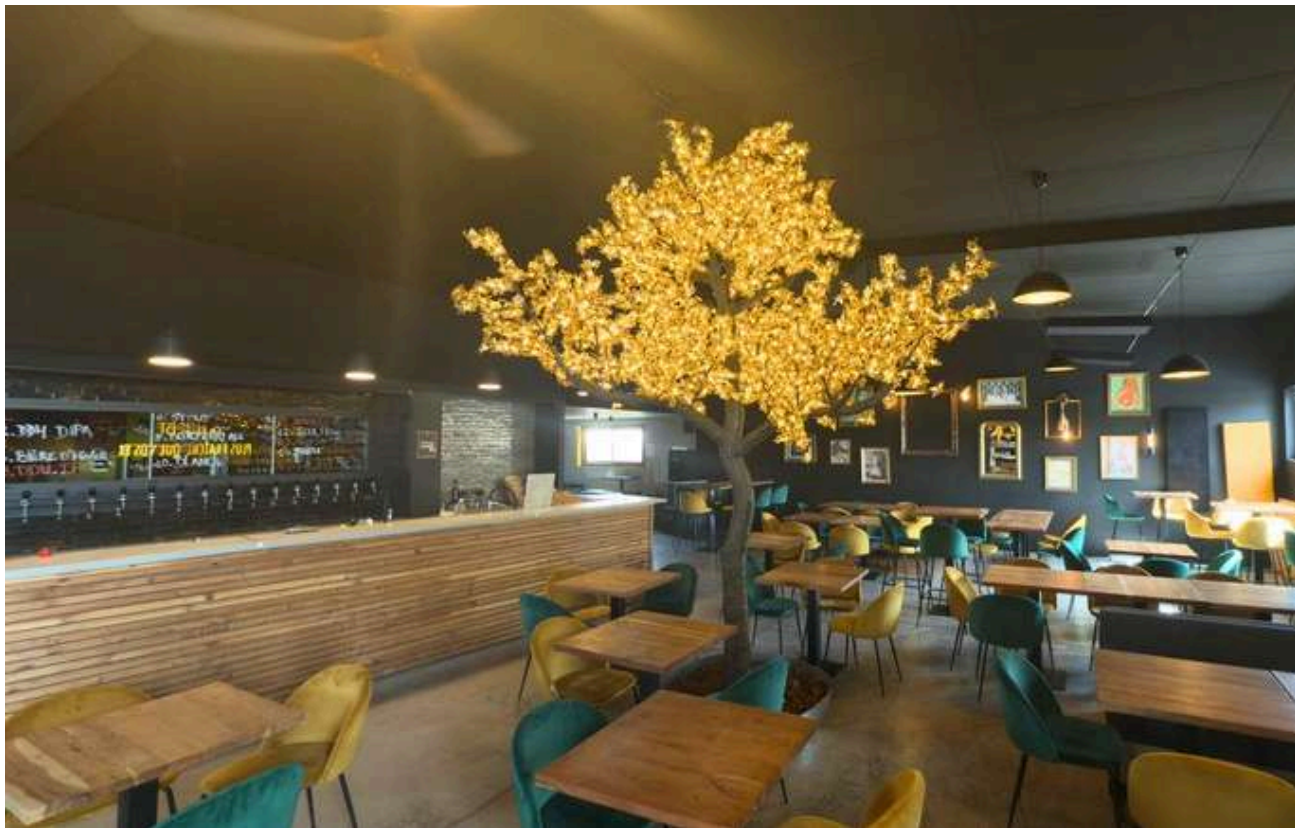
Gaya club La Valentine