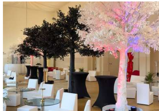
Festival de Cannes