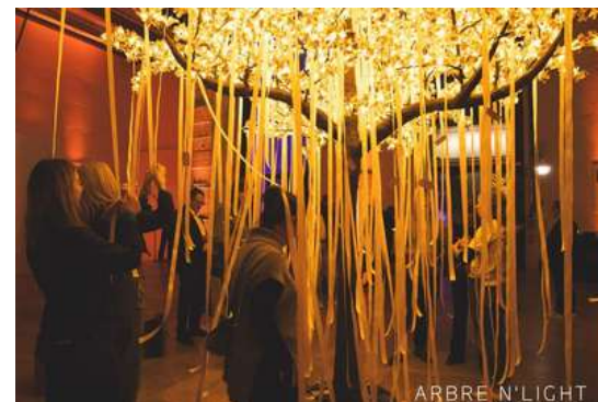
Palais de Tokyo Paris