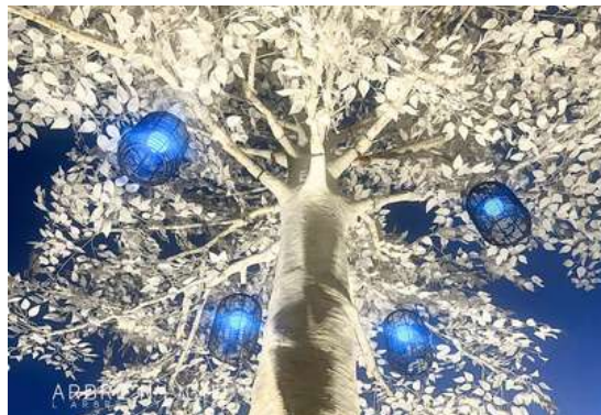
Events Saint Tropez