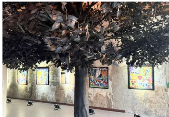
Galerie Art Money PACA