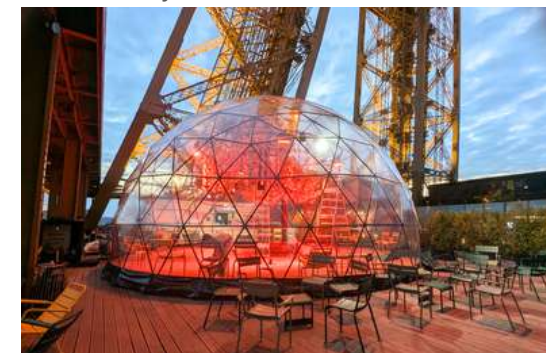
Palais de Tokyo Paris