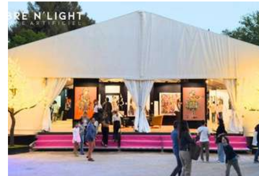
Smart Aix en Provence