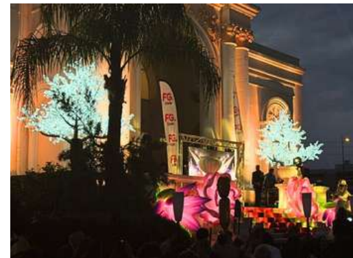
Festival de Cannes