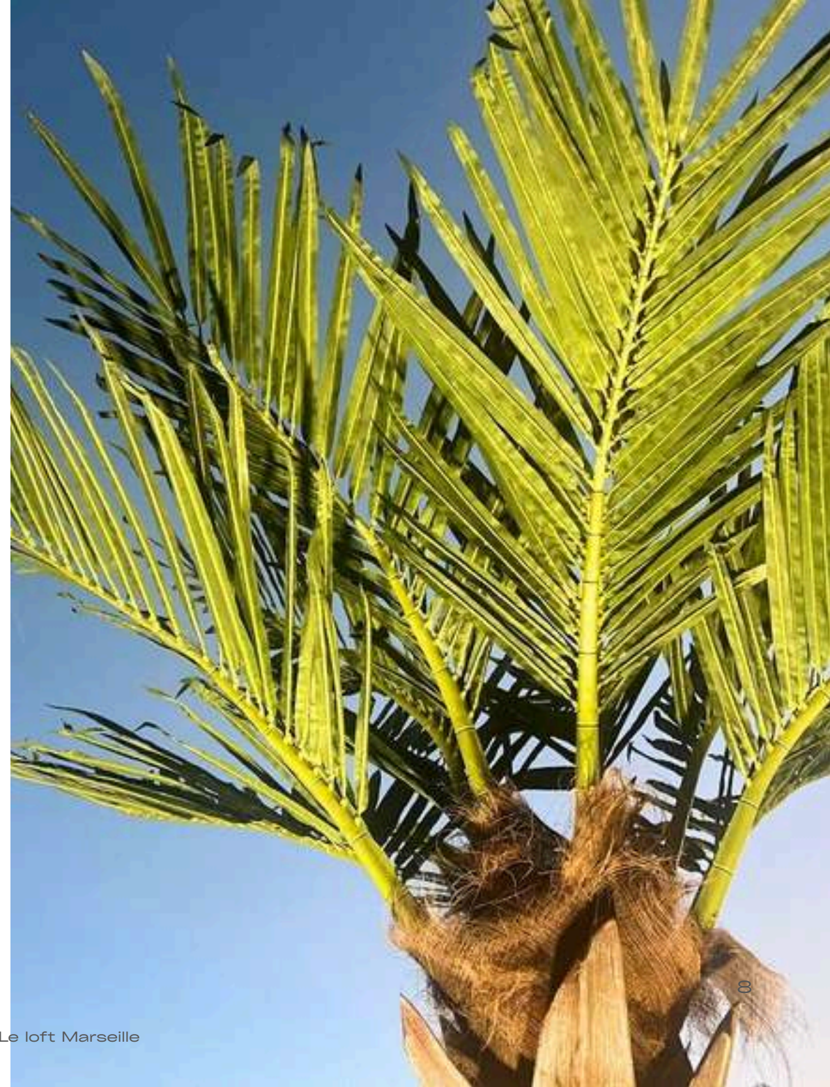
Le loft Marseille

As a professional, you benefit from a special discount on our products.