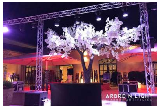
Chateau Saint hilaire Coudoux