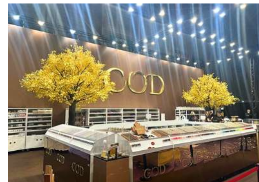
Parc Chanot Marseille