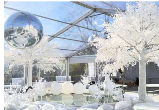
Pavillon Monticelli Marseille